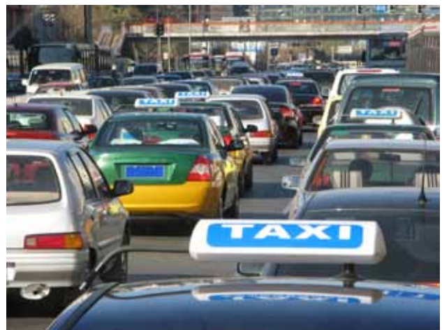
中国道路交通排放模型可以测算交通拥堵情况下的排放影响

市道路上的机动车类型有哪些,小汽车和公交车的燃油类型以及油耗分别是多少,在何种交通路况下机动车排放少于其他路况以及不同类型机动车行驶总里程数据等等。