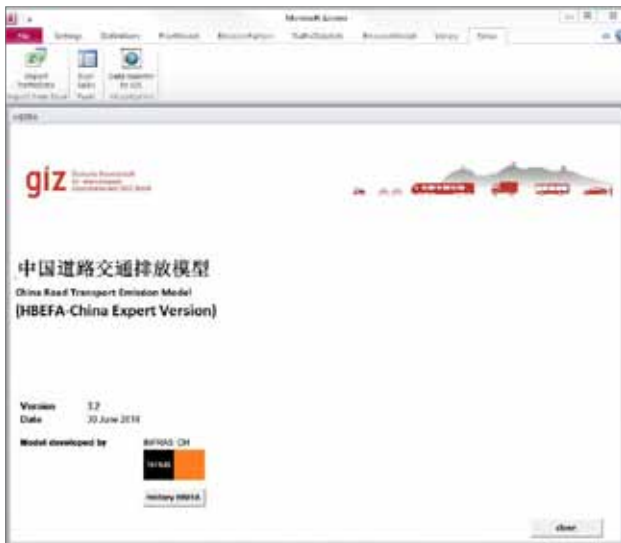
中国道路交通排放模型启动界面